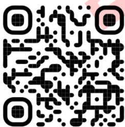
PROSTANKI WEB SITE